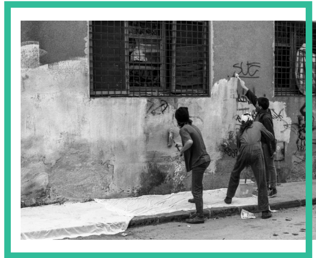
Feines de manteniment al Casal okupat.

plaça roja de Ca n'Anglada, acompanyades pel senador Lluís Maria Xirinacs amb l'objectiu d'abandonar el barraquisme i aconseguir un habitatge digne. La Asociación de Trabajadores por una Vivienda Digna va ser creada uns mesos abans per tal de donar solucions reals al problema de l'habitatge. Aquella va ser la seva primera acció que va acabar amb l'ocupació del bloc de pisos conegut com a polígon de Can Vilardell. Els blocs portaven més de dos anys construïts sobre un terreny rústic i sense complir els requisits mínims de l'època. La ATVD, després d'intentar negociar amb l'Ajuntament, va decidir, finalment, okupar els habitatges de dos blocs de pisos. No van trigar en arribar les unitats d'antiavalots amb ordres clares de desallotjar, mentre centenars de persones es reunien per donar suport a l'acció. A les 23h, la policia va començar a desallotjar, fent ús de pistoles amb pilotes de goma i pots de fum contra els mobilitzats. Tots van ser desallotjats. Tanmateix, la ATVD va tornar a mobilitzar-se, okupant dos