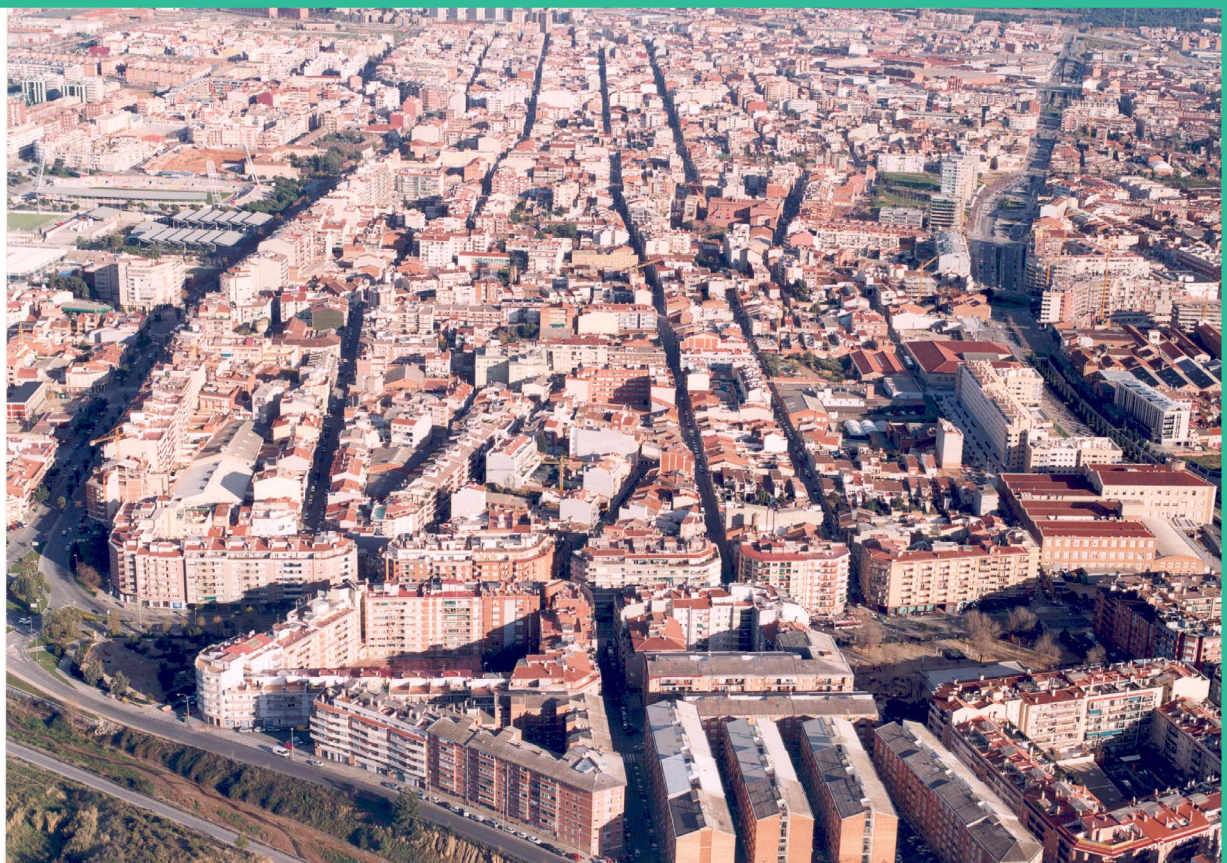
Fotografia del barri del Torrent de Pere Parres: Terrassa des de l'aire. 01/12/2002. ID: 178083.

ra més intensa les associacions de veïns i veïnes (AAVV) i d'altres entitats de caràcter associatiu, arrel de la manca de recursos destinats per part de l'Ajuntament a aquells barris que van patir més el desbordament de les rieres. A més a més, els anys posteriors del final de la dictadura i la posada en marxa de la democratització del país, combinada amb un canvi generacional que donava pas a una joventut amb capacitat d'acció a la vida pública, van propiciar un esclat vital per moltes persones que es va traduir en una sèrie de moviments socials que es van dedicar a denunciar les injustícies del seu temps. També es van posar de manifest les ganes de sortir al carrer i gaudir. Prova d'això van ser la quantitat