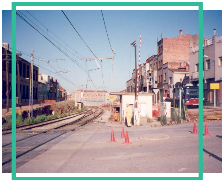
Fotografia del soterrament de la via del tren: Obres soterrament RENFE. 01/01/1990. Jenar Indurain Rubí. ID: 665559. Arxiu Municipal de Terrassa (AMAT).

llarg dels anys. Un procés que, a dia d'avui, segueix encara ben viu. 7 8