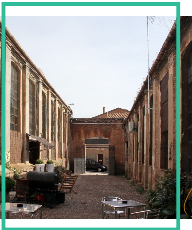
Fotografia del pati exterior de l'Ateneu Candela, antic Vapor Albiñana: Vapor Albiñana i Ribas. 08/10/2014. ID: 273182.

Ubicat també al carrer Sant Leopold, el projecte El Corralito va néixer a arrel de la motivació d'algunes artistes terrassenques de configurar un projecte comunitari i de la necessitat de trobar un espai on desenvolupar les seves activitats artístiques. El projecte englo-