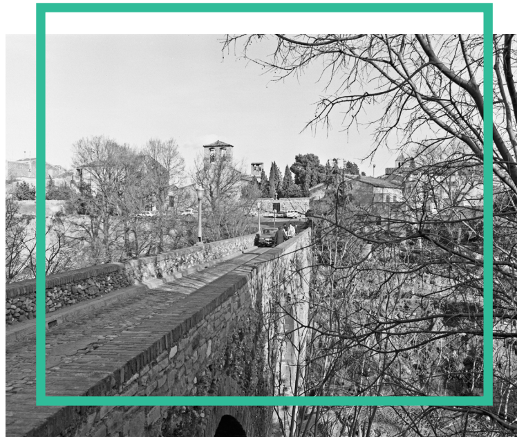
Fotografia del pont que connectava Terrassa amb el Poble de Sant Pere: Pont de Sant Pere. 23/01/1984. ID: 648515.

Un altre factor que va causar un gran impacte en el model associatiu i veïnal d'alguns barris de la ciutat va ser el fet migratori, sobretot entre els anys 60 i 70 degut a que Terrassa, igual que altres ciutats de l'àrea metropolitana de Barcelona, havia agafat renom com a referent industrial i fabril a la zona. Aquest fet va fer que moltes famílies triessin aquest tipus de ciutat com a lloc de destí. Les famílies que venien d'altres punts del país, sobretot de zones com Andalusia i l'Aragó, acostumaven a tenir pocs recursos quan arribaven. Moltes eren famílies provinents de zones