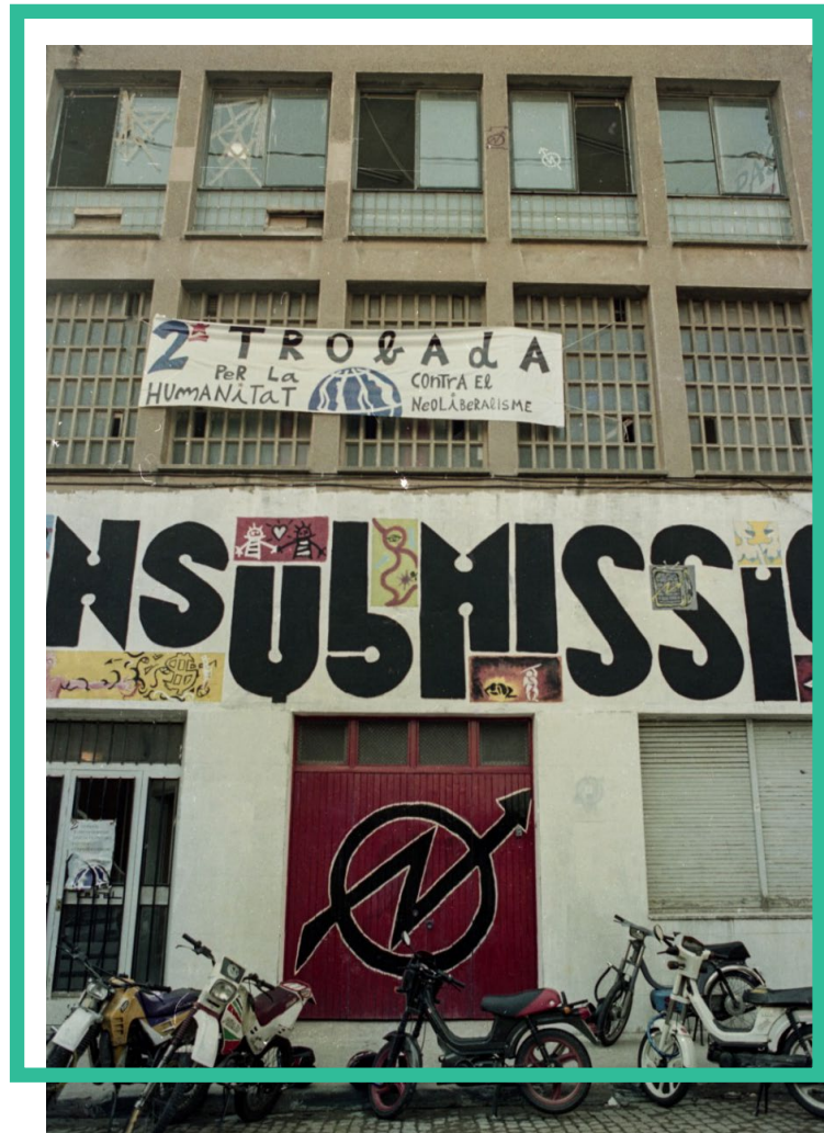
Casal Okupat.

cialment, un temps més tard de la seva okupació, el Kasalet va passar a ser un punt de reunió i trobada per molta gent de Terrassa: un espai que el 2005, després d'una sèrie de reformes, es va configurar com el Kasalet que coneixem avui en dia, amb el nom de Casal okupat i autogestionat Joan Berney.