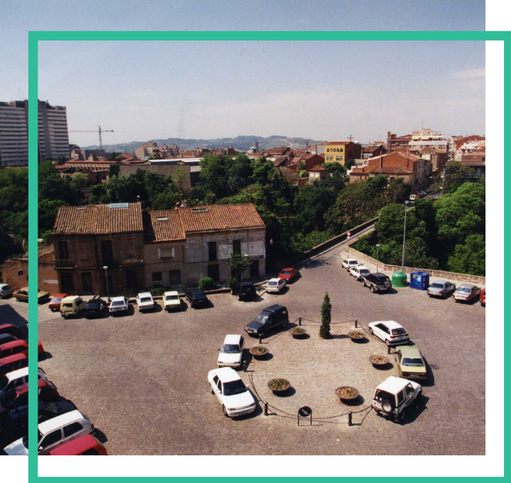
Fotografia del barri de l'Antic Poble de Sant Pere: Plaça Rector Homs [ANTIC POBLE SANT PERE, BARRI]. 01/01/1995.