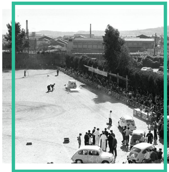
Gimcana grup 600 Agencia Seat. Camp de l'Agut. 22/10/1961. ID: 745983.

Crespi i el Club Bàsquet Sant Pere són les entitats que més dinamitzen la xarxa sociocultural de l'Antic Poble de Sant Pere. El Cau, un col·lectiu format essencialment per nens i joves, més enllà de tirar endavant activitats pròpies de l'entitat, s'involucra amb el barri i els seus esdeveniments. Explica en Jaume Rosset que, quan l'AV munta activitats dirigides a la canalla, es conviden els joves del Cau a formar-ne part, donant peu a que es realitzin activitats transversals, intergeneracionals i més multitudinàries. D'altra banda, el Club de Bàsquet Sant Pere, un club amb més de 75 anys d'història, va néixer el 1945 amb el nom de Jóvenes